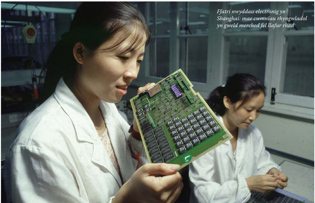
Efatri nwyddau electronig yn Shanghai: mae cwmnïau rhyngwladol yn gweld merched fel llafur rhad

Mae'r cam hunan-anfanteisiol hwn gan ferched yn digwydd oherwydd bod amodau gwaith ar lefelau uchaf y byd corfforaethol yn anhyblyg, ac felly'n anaddas ar gyfer