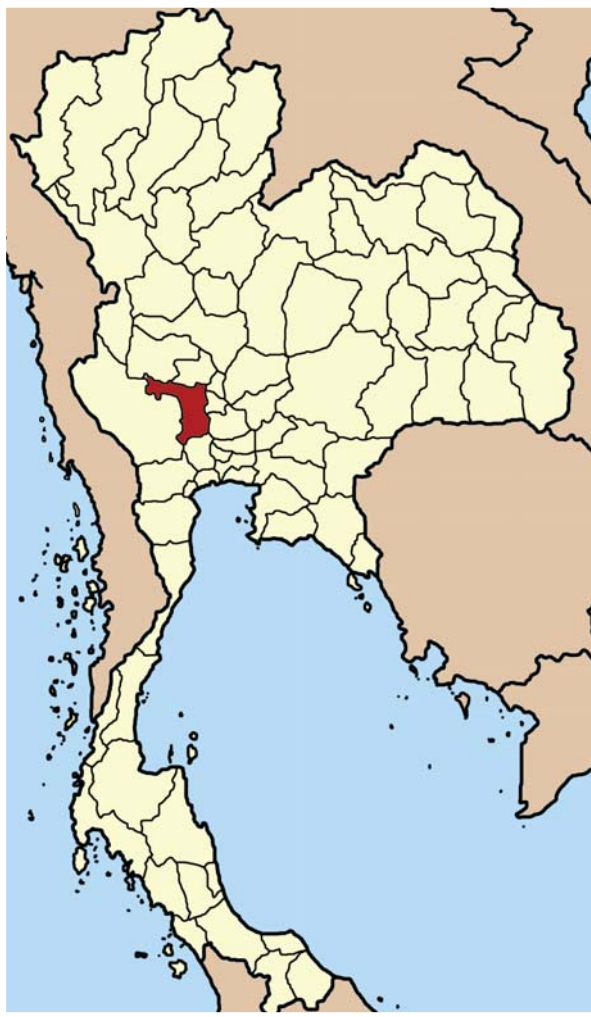
Ffigur 5: Talaith Supanburi, Gwlad Thai

Roedd hyn yn newid mawr gan fod ffermio dwys berdys cyn hyn wedi'i ganolbwyntio ar hyd ardaloedd cul o dir ar yr arfordir. Yr unig ffordd o ddatblygu ffermio halwynedd isel yn gyflym mewn ardaloedd dŵr ffres oedd drwy symud symiau mawr o ddŵr môr neu ddŵr pantiau heli i'r mewn. Roedd yr elw a wnaed drwy dyfu reis yn llai ffafriol na'r elw a wnaed o ffermio berdys, felly crëwyd her sylweddol o ran rheoli tir a dŵr.