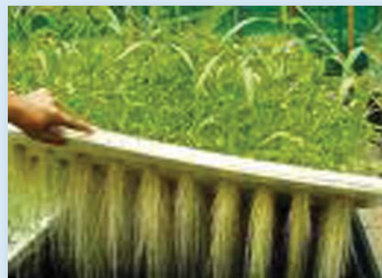
Ffigur 2: Defnyddio aeroponeg i dyfu planhigion