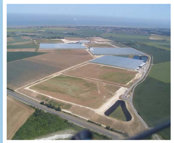
Ffigur 3a: Safle Thanet Earth

Thanet Earth, yng Nghaint, yw datblygiad tŷ gwydr mwyaf y DU. Mae'n rhannol dan berchenogaeth Fresca Group, cwmni enfawr sy'n cyflenwi bwyd ffres i archfarchnadoedd. Disgwylir iddo agor yn 2010 a bydd yn tyfu dros 1 miliwn o blanhigion ar unrhyw adeg. Er bod y raddfa hon o gynhyrchu i'w gweld yn yr Iseldiroedd, nid oes dim o'i fath yn y DU. Bydd pob un o'r saith tŷ gwydr yn 140m o hyd, a maint 10 cae pêl-droed. Gyda'i gilydd, byddant yn gorchuddio 220 acer. Disgwylir i'r datblygiad ddarparu cynnydd o 15% yng nghynnyrch salad y DU. Bydd 2 miliwn o domatos yn cael eu casglu bob wythnos drwy'r flwyddyn, a phuprau a chiwcymerau yn cael eu casglu rhwng Chwefror a Hydref. Awgryma'r ffigurau ein bod ar hyn o bryd yn cynhyrchu 3% neu 4% yn unig o'r hyn yr ydym yn ei fwyta; er enghraifft, 1 yn unig o bob 10 pupur ac 1 o bob 3 ciwcymer.