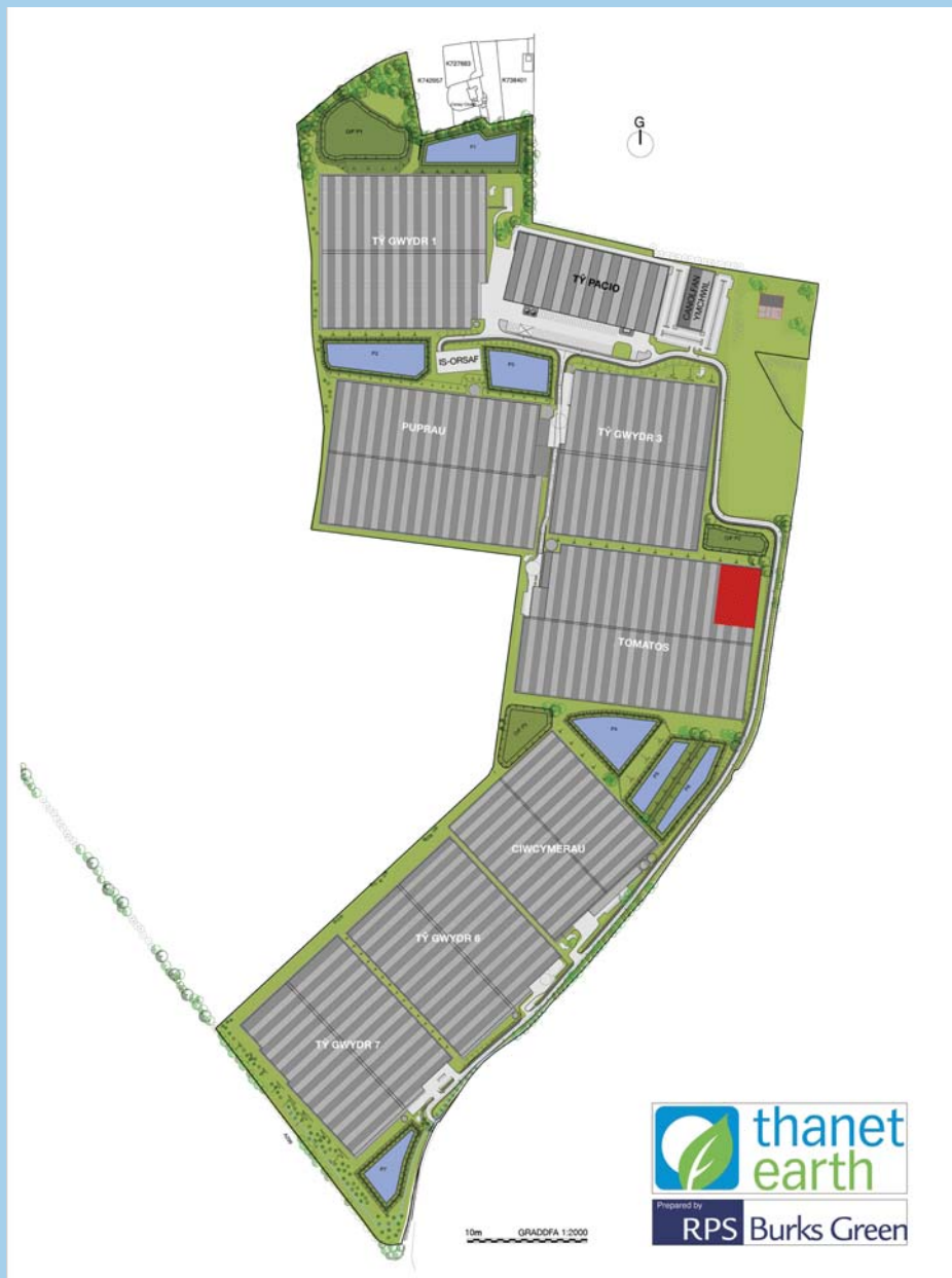
Ffigur 3b: Cynllun o safle Thanet Earth