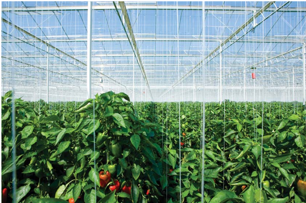
Ffigur 3c: Tyfu puprau mewn tŷ gwydr yn Thanet Earth

Mae gan Thanet Earth nifer o nodweddion sy'n awgrymu ei fod yn ffordd gynaliadwy o gynhyrchu bwyd: