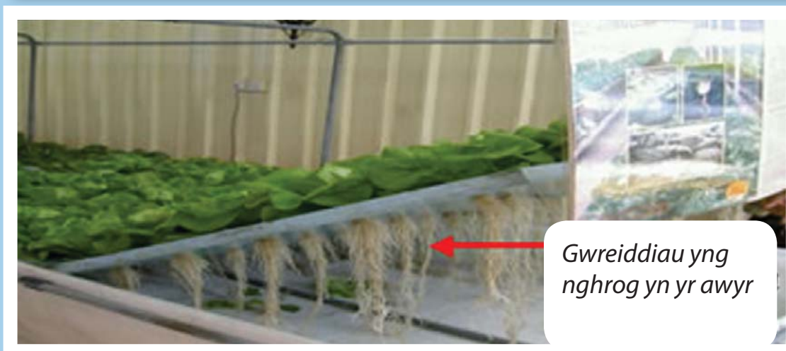
Efigur 4: Tyfu planhigion yn Aero-Green

O gafn wedi'i selio oddi tano, chwistrellir niwlen denau o faetholion tawdd a fydd yn glynu at y gwreiddiau. Mae argaeledd aer o amgylch y gwreiddiau yn hanfodol i gefnogi tyfiant da ac iach. Mewn aeroponeg, mae'r aer yn bresennol, yn wahanol i'r system hydroponeg lle mae'r dŵr yn cael ei gylchu er mwyn awyru'r hydoddiant.